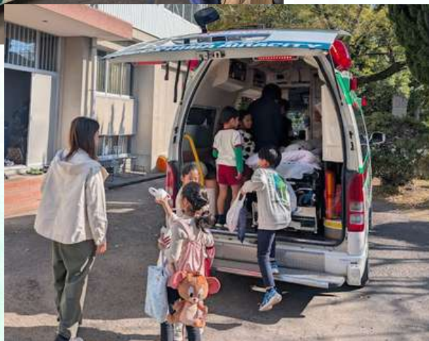
だじょう健康福祉まつり